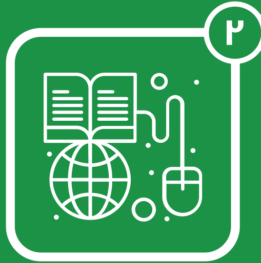
قواعد البيانات الذكية